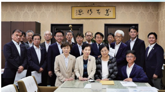
財務省 斎藤副大臣へ要望

必要な水資源の安定供給のため適切な維持管理と利水治水の課題解決に向けて施策の推進を要望しました。今回は、令和8年度概算要求を迎え、更なる事業推進と継続、さ