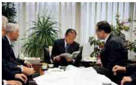
自由民主党本部 二階俊博 総務会長・ 国土強靱化総合調査会長