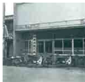
昭和37年頃の阿南市商工会（富岡町）

阿南商工会議所会館、阿南市立勤労青少年ホームの合同落成式挙行される 阿南市観光協議会設立。 第1次オイルショック（10月） 変動為替相場制に移行（2月）