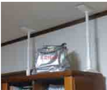
写真3 我が家の備え (家具転倒防止装置と非常持出袋)

さて、今回はこのような表現をしましたが、内容は今まで何となく聞いてきた「自助・共助・公助」の精神ではないでしょうか。それは、自分で助かる努力をする。共に助け合う、公的機関に助けをもらうことでもあります。防災の第一歩は「知ること」、次に「備える」「逃げる」「絆」の話をさせていただきま