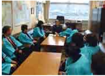
国土交通省 深澤淳志道路局長