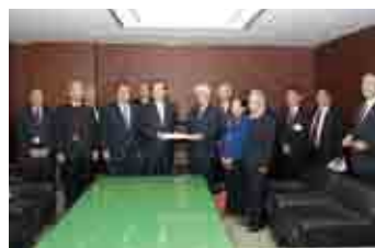
国土交通省 太田昭宏 国土交通大臣