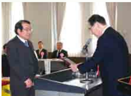
岩浅市長より受賞者に表彰盾の授与