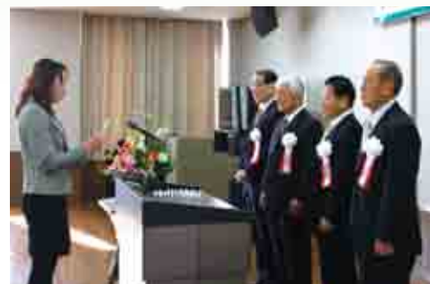
謝辞を述べる受賞者代表