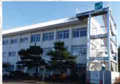
写真2 津波避難階段（阿南高専）

でしょうか。身近なことでは、非常持出袋を用意することや、家具転倒防止策を行うことができます。写真3は我