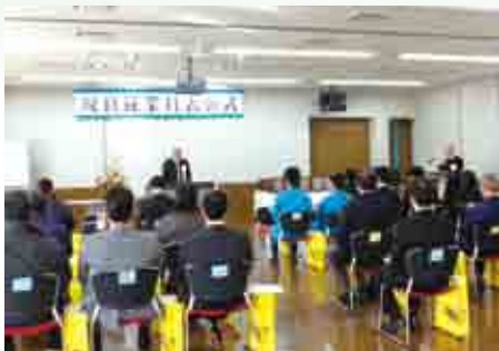
平尾会頭よりお祝いの挨拶