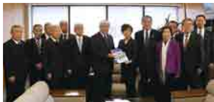
厚生労働省 山本香苗 副大臣

徳島県 南部圏域の中核医療機関である阿南医師会中 央病院 (阿南市医師会) と阿南共栄病院