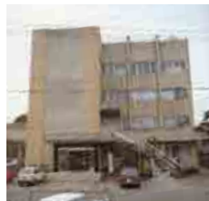
昭和47年落成の阿南商工会議所会館