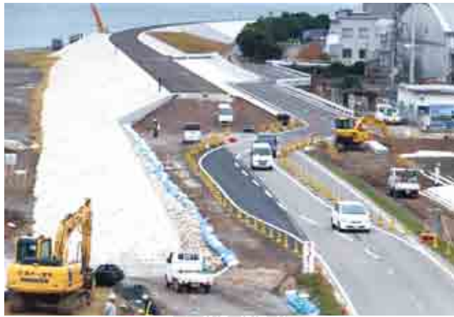
写真1 那賀川下流の堤防嵩上げ工事

前号においては、自分たちの住むまちを時間軸で「知る」ことが防災の第一歩であることを説明しました。もちろん知るべき内容については、安全な場所とか災害の種類・メカニズムなど色々なことがあります。次にすべきことは何でしょうか。第一歩が「知る」ことなら第二