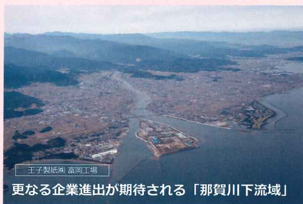
更なる企業進出が期待される「那賀川下流域」