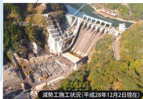
減勢工施工状況(平成28年12月2日現在)