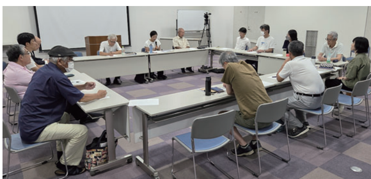
那賀川を学ぶ講座第12回：感想を発表